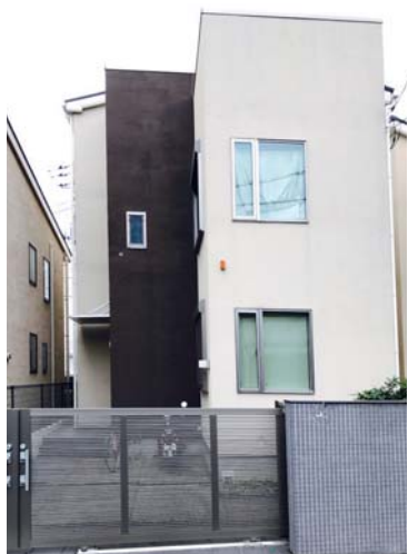
「ユアネーム」の外観

国は地域包括ケアの中で、高齢者を施設から在宅へのシフトを考えており、在宅を支えるサービスとして、訪問看護は重要な役割を担っています。全国的に見ても、東京で看護師を確保することはかなり困難ですが、5名の看護師を採用できました。キングスガーデン連合とも連携を取りながら、この事業が発展し、地域の中で世の光となる事が出来ますように、スタッフ一同、力を合わせていきます。