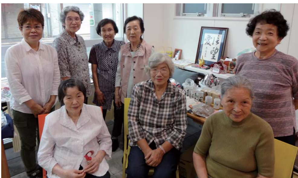
サランの会 作品展 9月11日

呉ペタニアホーム 呉ペタニアホーム長迫 ハレルヤユアネーム tel:0823-26-8844 tel:0823-23-2003 tel:0823-32-5980 tel:03-6915-1347