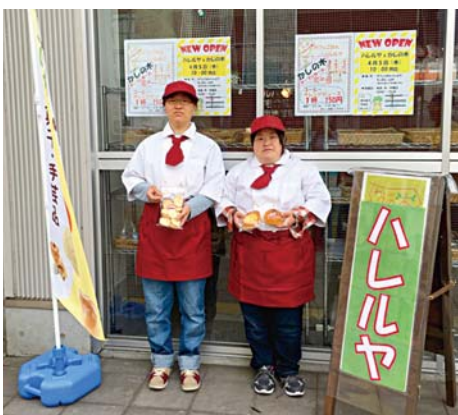
中通ハレルヤ かしの木ショップ 月・木 10時~15時 営業中

ショップでは、「かしの木」の皆さんが作ったパン、クッキーなどを販売しています。ぜひご来店ください。