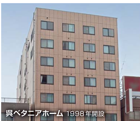
呉ペタニアホーム 1998年開設

呉ペタニアホーム tel:0823-26-8844 呉ペタニアホーム長迫 tel:0823-23-2003 ハレルヤ tel:0823-32-5980 ユアネーム tel:03-6915-1347