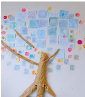
桜のバステルアート

個別対応デイサービスでは、壁画制作などのレクリエーション活動を通して、利用者の生活意欲を引き出し、自立支援に繋げた事を考えています。「その人自身」を知る為にも、このような活動は、利用者が周りの人との関係を築く良い機会です。利用者出来る範囲で参加して頂き、一緒に楽しんでいきます。