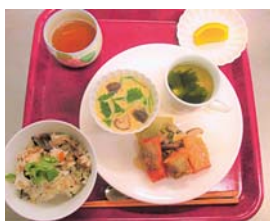
ある日の食事 血液サラサラメニュー ・ひじきご飯 ・さけのガーリック炒め ・茶わん蒸し ・すまし汁 ・オレンジ

良いものかを、利用者の方々と会話をしながら食事をしておられます。以前より「ベタニアのご飯は美味しい」と好評でしたが、これからも楽しみに感じて頂けるようになればと思います。