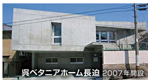
呉ペタニアホーム長迫 2007年開設