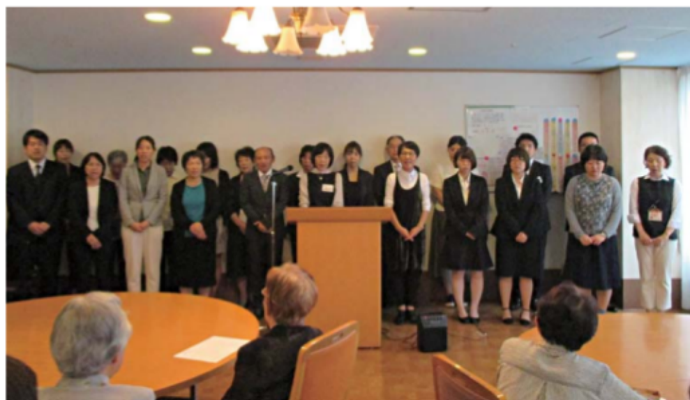
開設記念礼拝での職員合唱

社会福祉法人 政樹会 ケアハウス・デイサービスセンター サービス付き高齢者向け住宅 呉ベタニアホーム 呉ベタニアホーム長迫 ハレルヤ tel:0823-26-8844 tel:0823-23-2003 tel:0823-32-5980